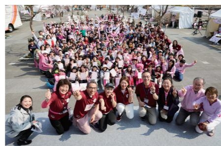
第18回(2019年開催) イベント集合写真