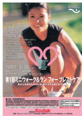
第1回(2002年開催) イベントポスター

そのころ欧米では、1980年代からの乳がん啓発運動が実を結び、死亡数は明らかに減少に転じていました。その運動を象徴するイベントがピンクリボンを掲げたラン&ウォークの大会です。日本でもこのムーブメントを起こそう。知っていれば、助かった命を救おう。そこで生まれたのが「ミニウォーク&ラン フォー プレストケア ピンクリボンウォーク」。2002年3月31日、第1回大会が開催されました。